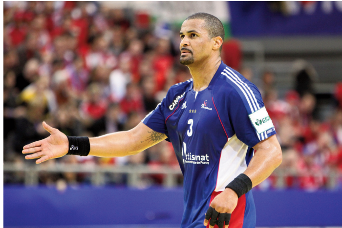
Didier au temps où, en équipe de France, il était la terreur des attaquants du monde entier.

Il prend sa retraite de joueur de club en 2013 sur un titre de champion de France avec le PSG et connaît sa dernière cape internationale (la 379e, seuls Jackson Richardson avec 417 et Jérôme Fernandez avec 387 ont fait mieux) au championnat du monde 2013 en Espagne. Il faut désormais découvrir Didier Dinart l'entraîneur. Qu'est ce qui lui donné l'envie d'entraîner ? « C'est venu au fur et à mesure de ma carrière. À Ciudad Real plus précisément où Talant Dujshebaev a changé ma vision du hand à 29 ans. Avant ça, j'étais le "patron" de la défense, mais