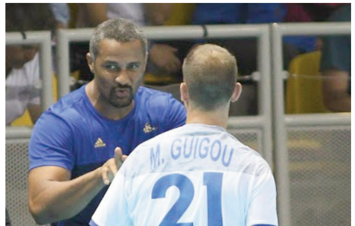
En plein «coaching» sur le banc, il est le parfait relais vers les joueurs, des stratégies élaborées avec Claude Onesta.