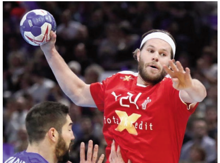
Mikkel HANSEN (DAN) sera une nouvelle fois l'atout n°1 du Danemark

la jeunesse est une constante de la sélection tricolore avec en plus les