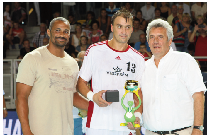
Claude, en compagnie de Didier DINART, remettant son trophée de meilleur buteur de l'ET15 à Momir ILIC de Veszprem

Ce seront les 4 e et derniers Jeux de Claude Onesta à la tête des Bleus, mais il n'y pense pas encore. «Je ne suis pas centré sur moi. Je ne pense pas à l'émotion que je pourrais ressentir. Je dois trouver et résoudre les problématiques posées par les autres. Il n'y aura aucune frustration, mais une déception si cela venait à finir mal. Je sais néanmoins que je peux partir car après moi les choses continueront à être opérationnelles. Cette équipe a un potentiel impressionnant et quel