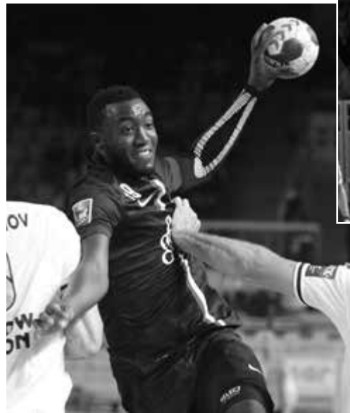
LES MATCHS D'HIER