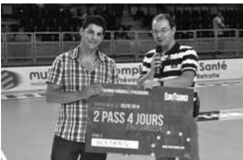
Eurotournoi Handball @Eurotournoi 13 h Bravo à @xwinten qui remporte deux pass 4 jours pour l'année prochaine ! #etsselfie #wearehandball pic.twitter.com/kgiFHggyoh

Faites comme eux, et tweetez vos impressions avec le hashtag #EuroTournoi les meilleurs tweets seront publiés chaque jour ! ;)