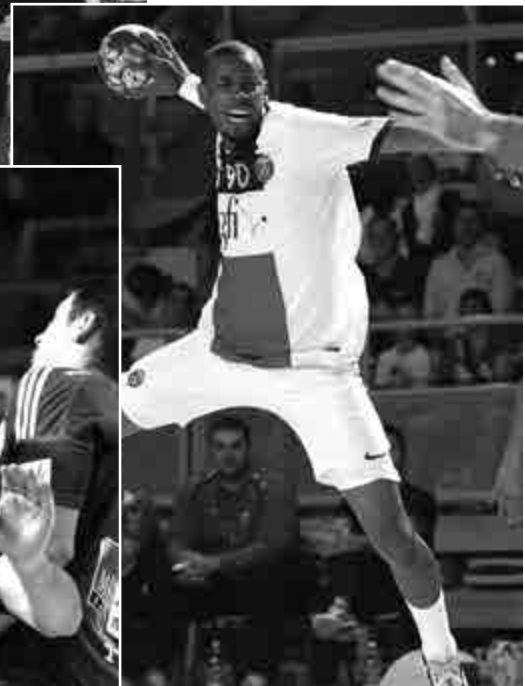
LES MATCHS D'HIER