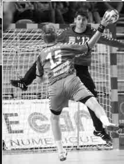
Les matchs d'hier