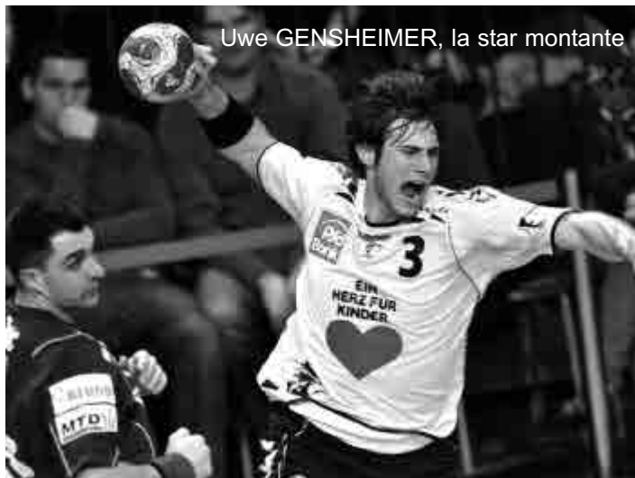
Uwe GENSHEIMER, la star montante

grands d'Europe souhaitent avoir dans leurs rangs, un diable de pivot croate nommé