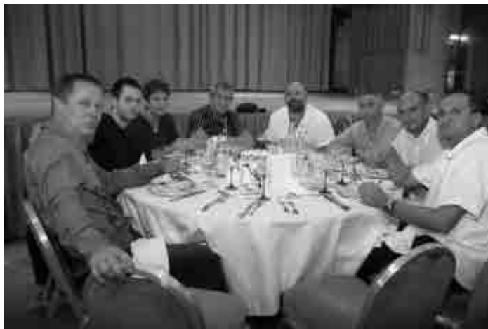
Grands habitués de l'épreuve, nos deux paires alsaciennes lors du banquet 2006

du Monde Féminin le tout saupoudré de quelques matches de finales de Champion's League. Si les deux premières paires qui ont largement aidé à faire des premiers matches de l'ET07 par leur souci permanent de faire vivre le jeu dans le respect des règles ont aussi la particularité d'être les sifflets majeurs de l'Alsace depuis des années, les efforts que vont faire Gilles Bord et