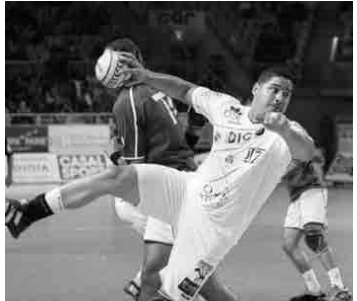
Rolando URIOS, le meilleur pivot du monde, transperçant la défense héraultaise

ronne a finalement échoué à Ciudad Real qui pourtant n'en menait pas large quand il fut mené de 7 buts en deuxième période. Mais les Rolando Urios Siareh