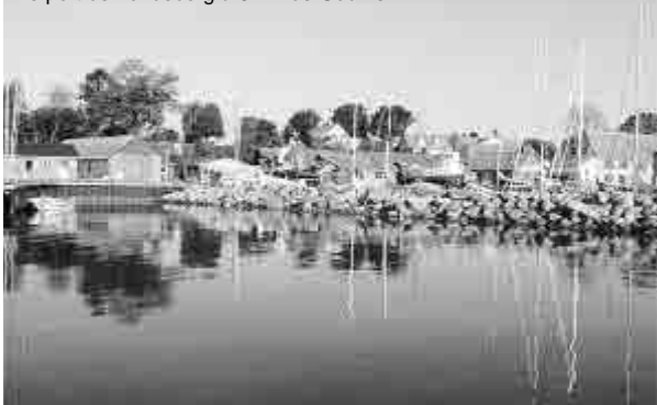
Le port de Lundeberg à 5 km de Gudme