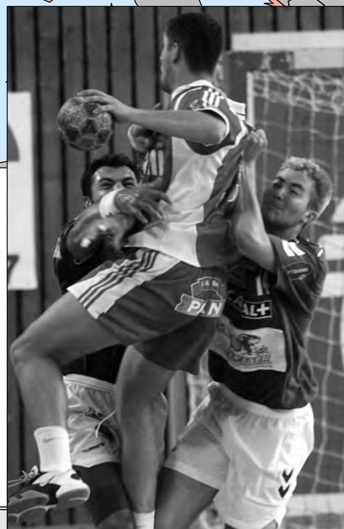
Toute la hargne des défenseurs sélestadien face à Metkovic