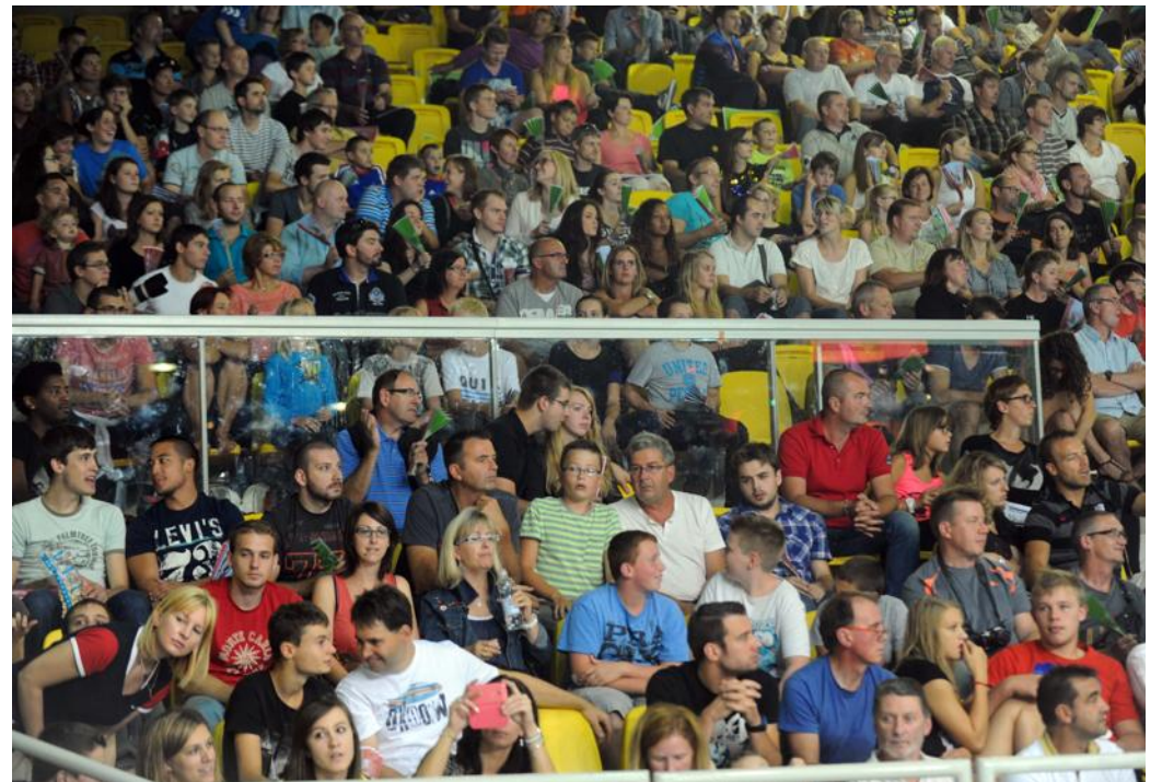
Près de 17 000 spectateurs sur quatre jours: le vingtième EuroTournoi a rencontré son succès habituel en termes de fréquentation.