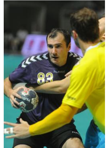
Moscou et Shelmenko au pied du podium.